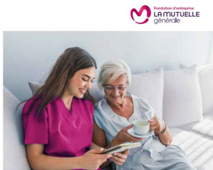
Fondation d'entreprise LA MUTUELLE générale Innovons solidaire !

Huit ans après la création de sa première fondation, La Mutuelle Générale lance aujourd'hui une Fondation d'entreprise au champ d'intervention plus vaste et dont les grandes orientations sont directement inspirées de sa raison d'être. Avec pour missions d'accompagner le bien- vieillir, d'améliorer la qualité de vie et de renforcer la solidarité entre les générations, elle apportera son soutien à des projets portés par des associations et par les élus et collaborateurs de La Mutuelle Générale.