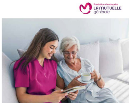
Fondation d'entreprise LA MUTUELLE générale Innovons solidaire !

Huit ans après la création de sa première fondation, La Mutuelle Générale lance aujourd'hui une Fondation d'entreprise au champ d'intervention plus vaste et dont les grandes orientations sont directement inspirées de sa raison d'être. Avec pour missions d'accompagner le bien-vieillir, d'améliorer la qualité de vie et de renforcer la solidarité entre les générations, elle apportera son soutien à des projets portés par des associations et par les élus et collaborateurs de La Mutuelle Générale.